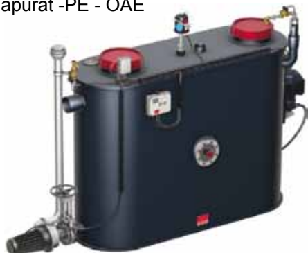
Farurat -PE - OAE